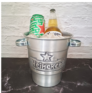
HC1005- FRAPERA DE ALUMINIO, CINCELADO, MED. 20 X 19 X 13