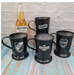
CH116 - CHOPP CERVECERO DE ALUMINIO, C/GRABDOS A LASER