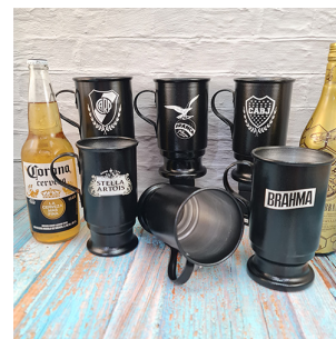
CH114 - CHOPP CERVECERO DE ALUMINIO, C/GRABDOS A LASER