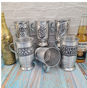
CH102 - CHOPP CERVECERO DE ALUMINIO, CINCELADO, CAP 0.95 LT