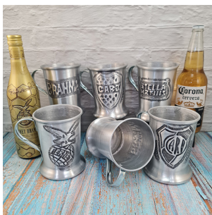
CH106 - CHOPP CERVECERO DE ALUMINIO, CINCELADO