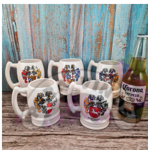
CH125 - CHOPP DE CERAMICA BARRIL 500 CL (10% OFF)