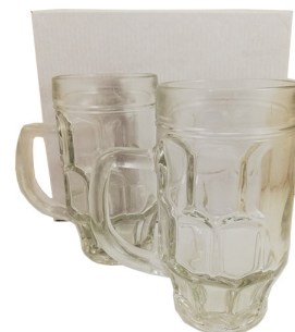
CH251 - CAJA REGALO CON 2 CHOPPS 500 CL