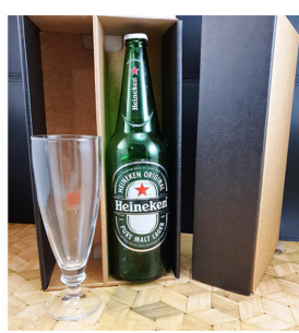
CH295 - CAJA ESTUCHE BOTELLA Y COPA CERVEZA 38.5CL