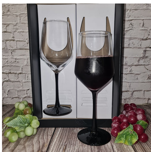
CR282 - CAJA REGALO CON 2 COPAS P/VINO, TALLO NEGRO, CAP 510ML