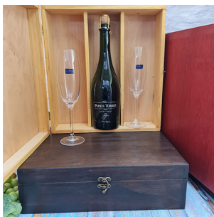
BO320 - CAJA MADERA CON 2 COPAS P/ESPUMANTE 230 ML