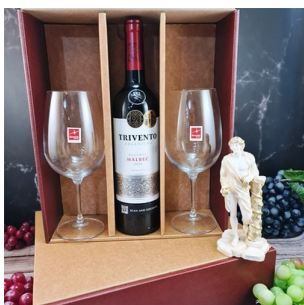
CR351 - ESTUCHE CON 2 COPAS PARA VINO 615 ML