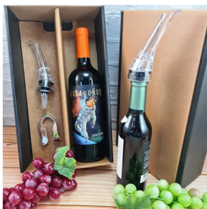
CB239 - CAJA ESTUHE PARA 1 BOTELLA CON ACCESORIOS