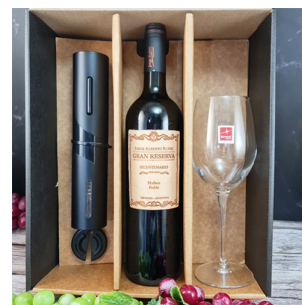
CR367 - CAJA CON 1 COPA, C. ITALIANO 615 ML Y DESC. A PILA