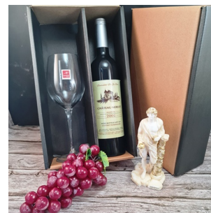
CR293 - CAJA CON UNA COPA PARA VINO, C. ITALIANO 470ML