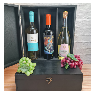
CB315 - CAJA NEGRA DE MADERA PARA 3 BOTELLAS