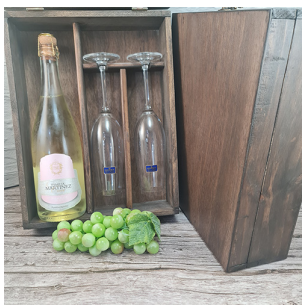
BO319 - CAJA MADERA C/ESPACIO P/1 BOTELLA + 2 COPAS CAP 230 ML