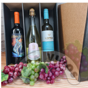
CB303N - CAJA REGALO PARA 3 BOTELLAS