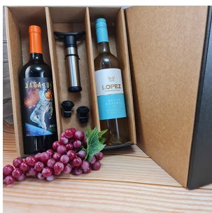
CB321 - CAJA PARA 2 BOTELLAS CON ACCESORIOS