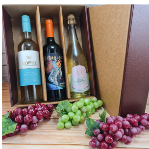
CB303B - CAJA REGALO PARA 3 BOTELLAS