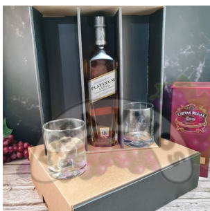
CR363 - CAJA CON 2 VASOS DE WHISKY 330 ML