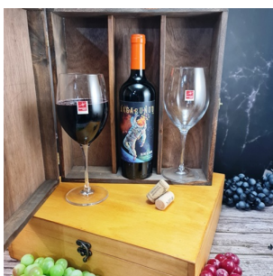
CR395 - CAJA DE MADERA CON 2 COPAS C. ITALIANO 615 ML