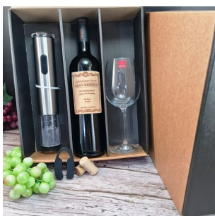
CR369 - CAJA CON 1 COPA C. RONA 450 ML Y DESC. A PILA