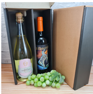
CB212 - CAJA REGALO PARA 2 BOTELLAS