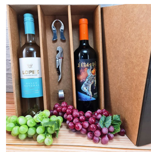
CB331 - CAJA PARA 2 BOTELLAS CON ACCESORIOS