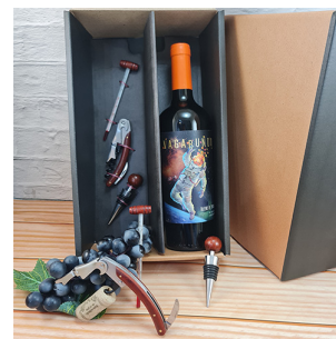
CB257 - CAJA ESTUHE PARA 1 BOTELLA CON ACCESORIOS