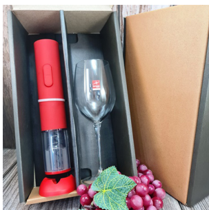
CR291 - CAJA CON COPA PARA VINO 470 ML Y DESC. A PILA